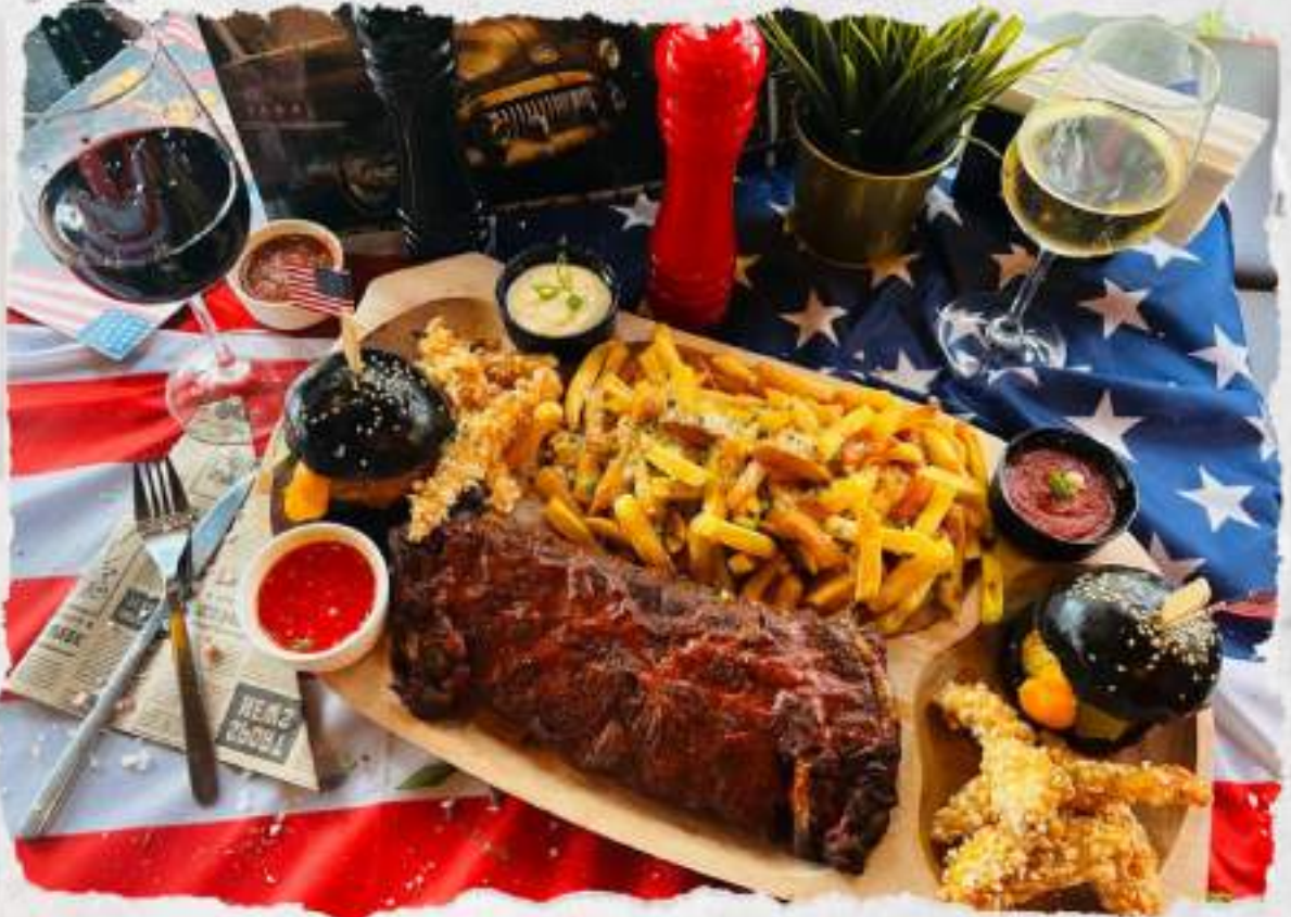
in a writer and joint bookman