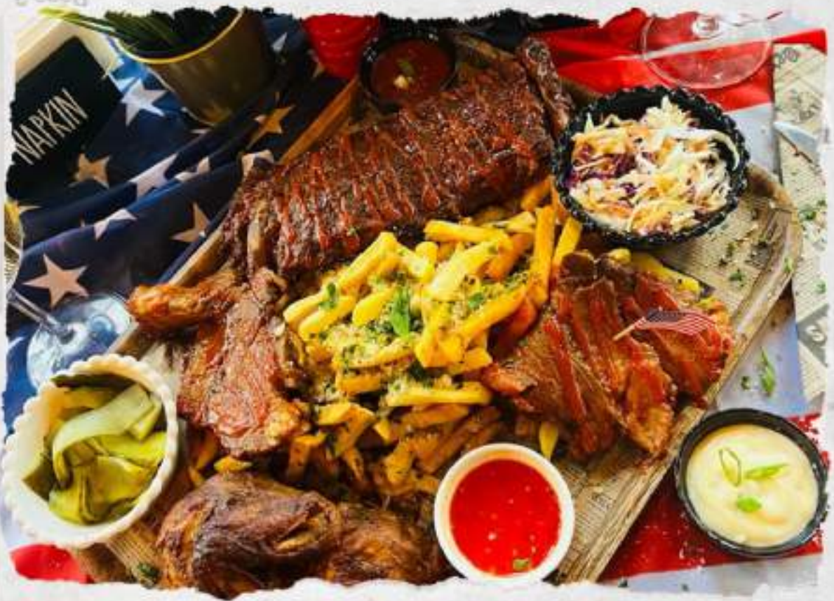
in a writer and joint bookman